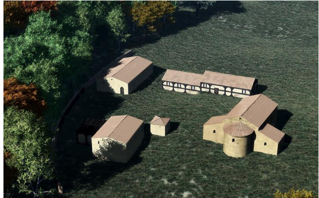
La deuxième fondation religieuse de Romainmôtier au VII e siècle, restitution

Félix aurait demandé aux moines de l'abbaye de Luxeuil de venir à Romainmôtier pour y apporter un renouveau du monachisme.