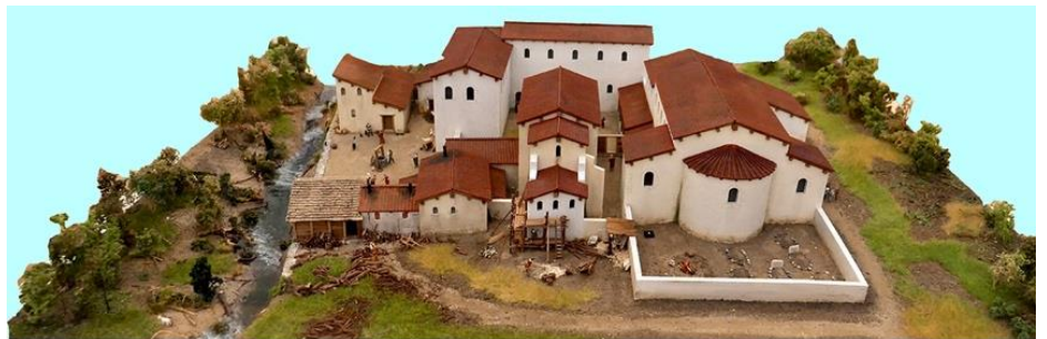
L'organisation monastique à Romainmôtier au VIII e siècle, maquette du MCAH

Entre le 7 e et le 8 e siècle, ils procèdent à d'importantes transformations des bâtiments, construisent une deuxième église au sud de celle construite au Ve siècle ou de la deuxième construite probablement après la fondation par Chramnelène.